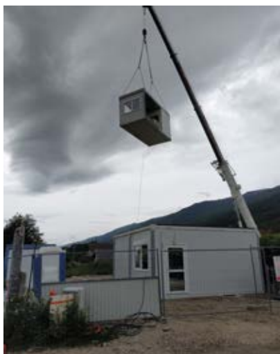
Installation des modules