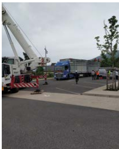
Livraison des modules

Bâtiments, travaux, études, raccordements aux réseaux : 427 000 € Ce montant sera subventionné à hauteur de 167 000 € par l'Etat et le Département de l'Ain.