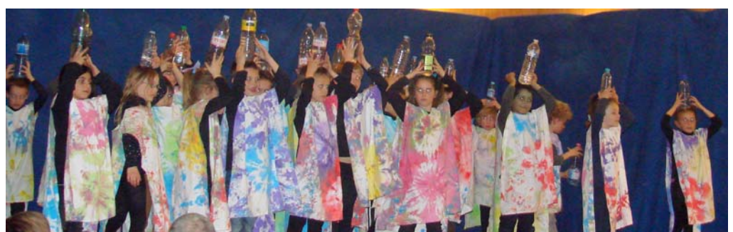
L'Afrique à l'école : avril 2013