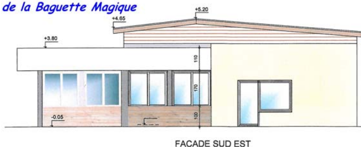
la nouvelle façade de la Baguette Magique

Un autre chantier important doit débuter d'ici l'été 2013, la mise en place d'un réseau séparatif eaux usées-eau pluviale au lotissement "Le Marais" à Avouzon. La CCPG va mettre en place le réseau EU, la commune récupérant le réseau actuel pour l'eau pluviale. Nous profiterons de ces travaux pour enterrer tous les réseaux secs du secteur. Ils vont engendrer pas mal de désagréments à ses habitants. Nous essayerons de les réduire au maximum, et nous comptons sur la compréhension de chacun.